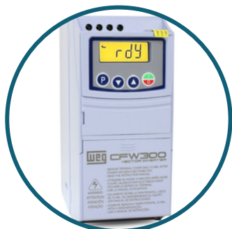
Inversor de frequência da Weg

O painel de controle da máquina possui um botão de emergência. Este, quando acionado, desliga a máquina imediatamente.