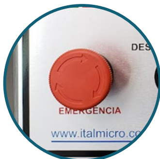
Botão de emergência