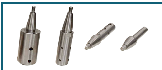
Mandris para fixação da ferramenta

A máquina acompanha 4 mandris para fixação da ferramenta, abrangendo uma grande variedade de tamanhos de bielas. O mandril tem um sistema de fixação rápida [através de um cone e uma rosca], o que facilita a fixação no eixo da máquina.