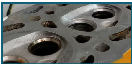
Sede de válvula

Máquina desenvolvida para esmerilhar assento de válvula via controle digital de batidas, substituindo o trabalho manual e minimizando o tempo de operação com precisão e rapidez.