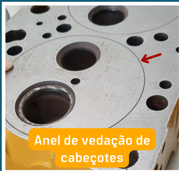
Anel de vedação de cabeçotes