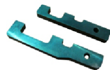
2 réguas alinhadoras