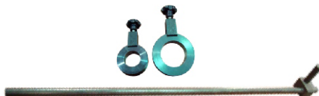
Dispositivo para comprar altura