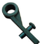
Fixador do relógio comparador